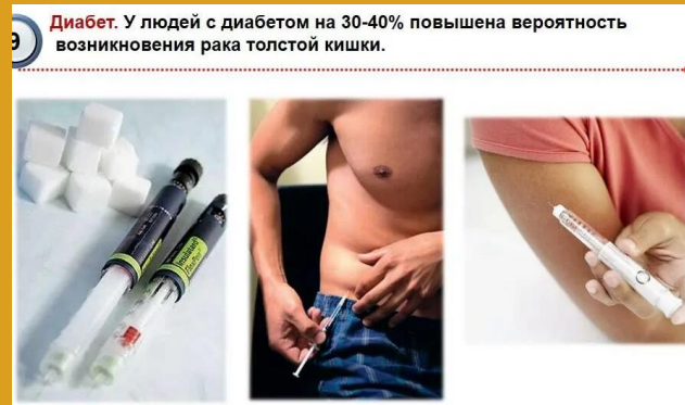
Диабет. У людей с диабетом на 30-40% повышена вероятность возникновения рака толстой кишки.